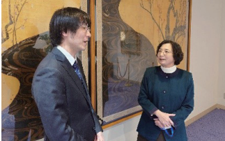
山梨県臨床心理士会会長